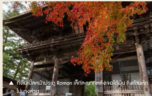
▲ กังเปเปิดหน้าประตู Romon เล็กมากหลังเจอไต้ฝุ่น กังก้านหักไปบางส่วน

พระประธานของวัด ก่อนจะลงบันไดกลับไปติดต่อไปยังวัดไซเมียวจิ และวัดโคซังจิสองวัดพุทธย่านทากาโอะที่เริ่มเปลี่ยนสีงดงามแล้ว