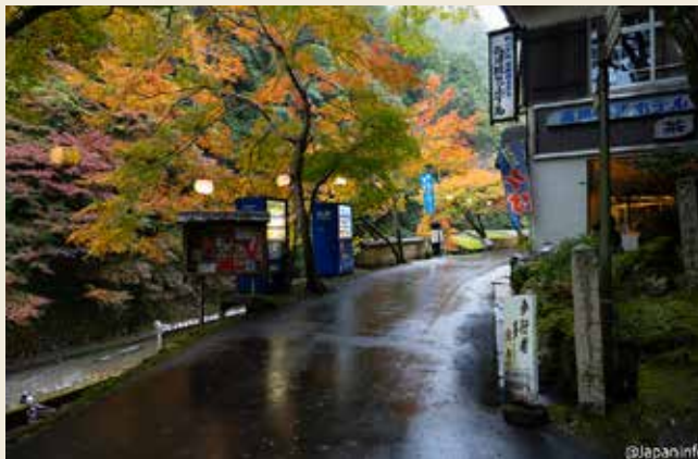
▶ โรงแรมเล็ก ๆ ริมน้ำโคชิอัน ให้บริการอาหารที่ร้อนปิ้ง รินน้ำด้วย

วัดจิงโกะจิ สร้างโดยวาเคะ คิโยมาโระ ชุนนางเฮอัน โดย บูรณะจากวัดตากาโอะ ต่อมาเมื่อพระคุโค่นำพุทธศาสนากลับมา เผยแพร่จากประเทศจีน ที่นี้จึงกลายเป็นศูนย์กลางการเผยแพร่ คำสอนและเป็นที่ ๆ ท่านเจ้าพรรษาอยู่ราว 14 ปีก่อนจะไปพัฒนา โคยะซัง โดยในปีค.ศ. 824 วัดได้รวมกับวัดของคนในตระกูลวาเคะ อีกวัดหนึ่ง เปลี่ยนชื่อมาเป็นวัดจิงโกะจิ ปีนี้จะเป็นปีที่วัดฉลอง ครบรอบ 1,200 ปี พร้อมฉลองการเกิดของพระคุโคะรอบ 1,250 ปี ด้วย ด้วยเหตุนี้วัดจึงเป็นเจ้าของวัดอุโบสถที่เกี่ยวเนื่องกับพระ คุโคะมากมาย พระโภาษชัยคุรุพระประธานที่ประดิษฐานในโบสถ์ คอนโดก็ขึ้นทะเบียนเป็นมรดกของ ประเทศ