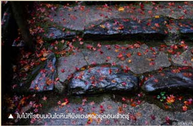
▲ ใบไม้ที่รอบบันไดหินสีเหลืองสดอยู่ตอนเช้าตรู่

ในเช้าวันที่ 19 พฤศจิกายนที่ผ่านมา ผู้เขียนขับรถประจำทางเที่ยว 7 โมงจากในตัวเมืองเกียวโตมุ่งหน้าไปที่ย่านทากาโอะ เมื่อลงรถที่ป้ายรถเมล์ก็พบว่า มีฝนพรำ อุณหภูมิบนเขาราว 6 องศา จากป้ายรถเมล์ก่อนอื่นต้องลงบันไดหินไปที่ริมแม่น้ำอิกราว 30 ชั้นได้ เมเปิดที่เรียงรายอยู่สองฝั่งแม่น้ำเริ่มมีสีเหลืองส้มถนัดตาติดกับสีฟ้าของน้ำอย่างดี สักพักจึงรีบสาวเท้าไต่ขึ้นบันไดหินกว่า 300 ชั้นไปอย่างระมัดระวัง ระหว่างทางก่อนถึงประตูโระมง มีเพิงร้านค้าเล็ก ๆ ให้นั่งพักขาได้ 2-3 แห่ง แต่ทุกแห่งยังไม่เปิดทำการช่วงเช้า จึงเดิน ๆ ถ่ายภาพระหว่างทางไปด้วย หยุดพักไปด้วย ทำยสุด