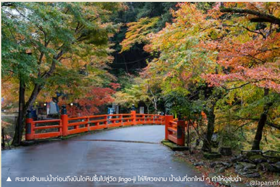
▲ สะพานข้ามแม่น้ำก่อนถึงบันไดหินขึ้นไปสู่วัด Jingo-ji ไล่สีสวยงาม น้ำฝนที่ตกใหม่ ๆ ทำให้ดูชุ่มฉ่ำ