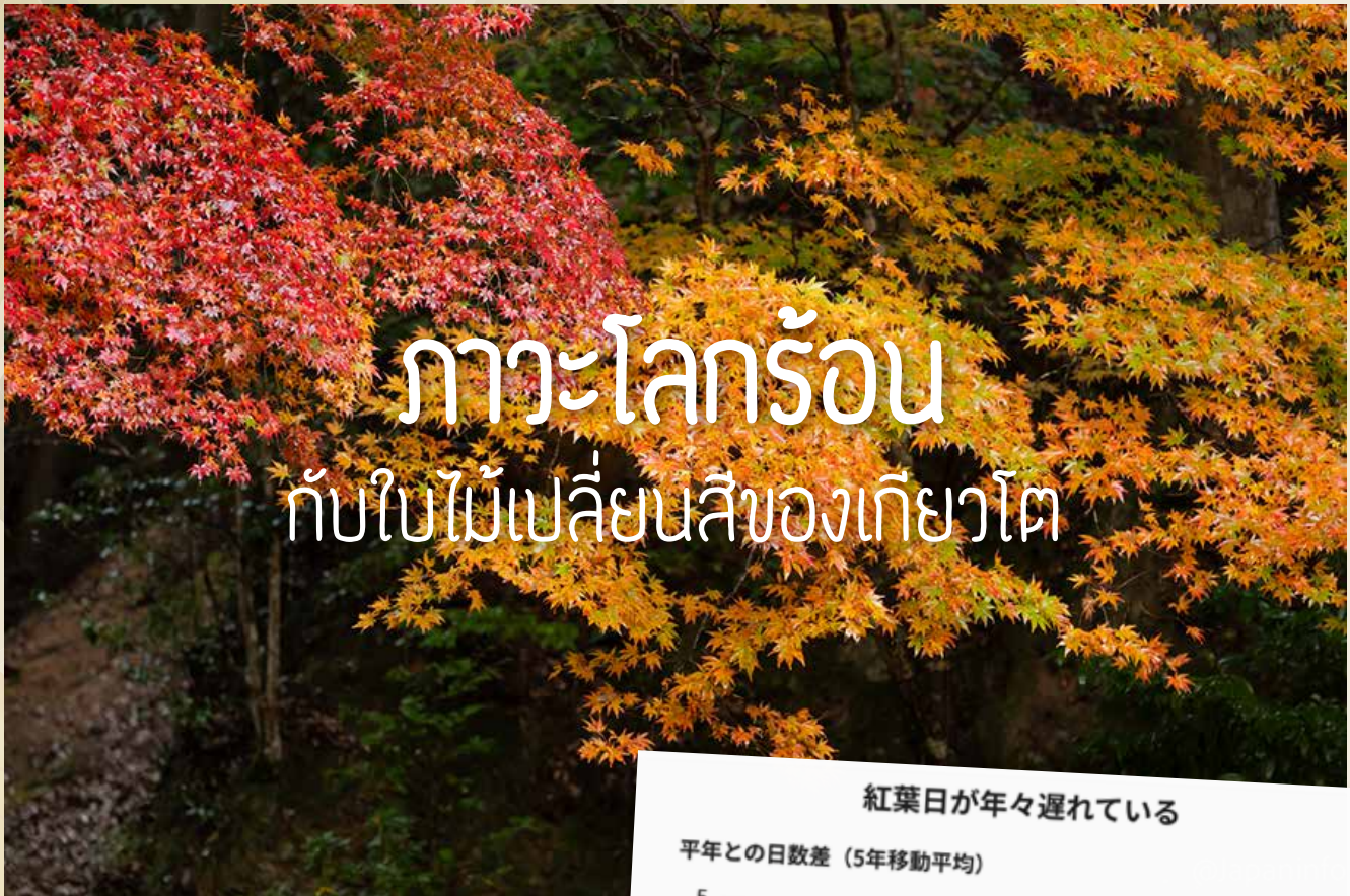
▲ ไม้ผลช่วยทำให้ใบไม้สีสดขึ้นมาก

ปีนี้เป็นปีที่โลกเผชิญกับสภาพอากาศแปรปรวน อุณหภูมิขึ้นสูงกว่าเฉลี่ยกันทั่วหน้า ทั้งนี้เชื่อว่าน่าจะมาจากภาวะโลกร้อน และดูเหมือนว่าความแปรปรวนดังกล่าวยังคงครอบคลุมไปถึงการเปลี่ยนสีของใบไม้ (โคโย) โดยเฉพาะเมเปิ้ลด้วย