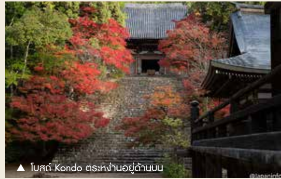
▲ โบสถ์ Kondo ตรงหน้าอยู่ด้านบน

เมเปิดต้นใหญ่ที่หน้าประตูโระมงมีกิ่งก้านที่สั้นลงและไม่คลุมทั่วประตูเช่นหลายปีก่อน น่าจะเพราะเจอผลกระทบจากไต้ฝุ่น แต่ในลานวัดยังมีเมเปิดใหญ่น้อยเรียงรายสีสดทุกต้นอยู่ และจุดที่สวยงามที่สุดคือที่ข้างบันไดหินหน้าโบสถ์คอนโด มีทั้งสีแดงสด เหลืองส้ม และเขียว ผู้เขียนขยับเดินไปข้างหน้าบ้างข้างหลังบ้างอยู่พักหนึ่ง เพื่อจับภาพโบสถ์โดยใสวิหารโกะไดโด และวิหารบิชะมงโดที่เรียงรายอยู่ตีนบันไดด้านใต้ของโบสถ์จนพอใจ จึงขึ้นไปนมัสการ