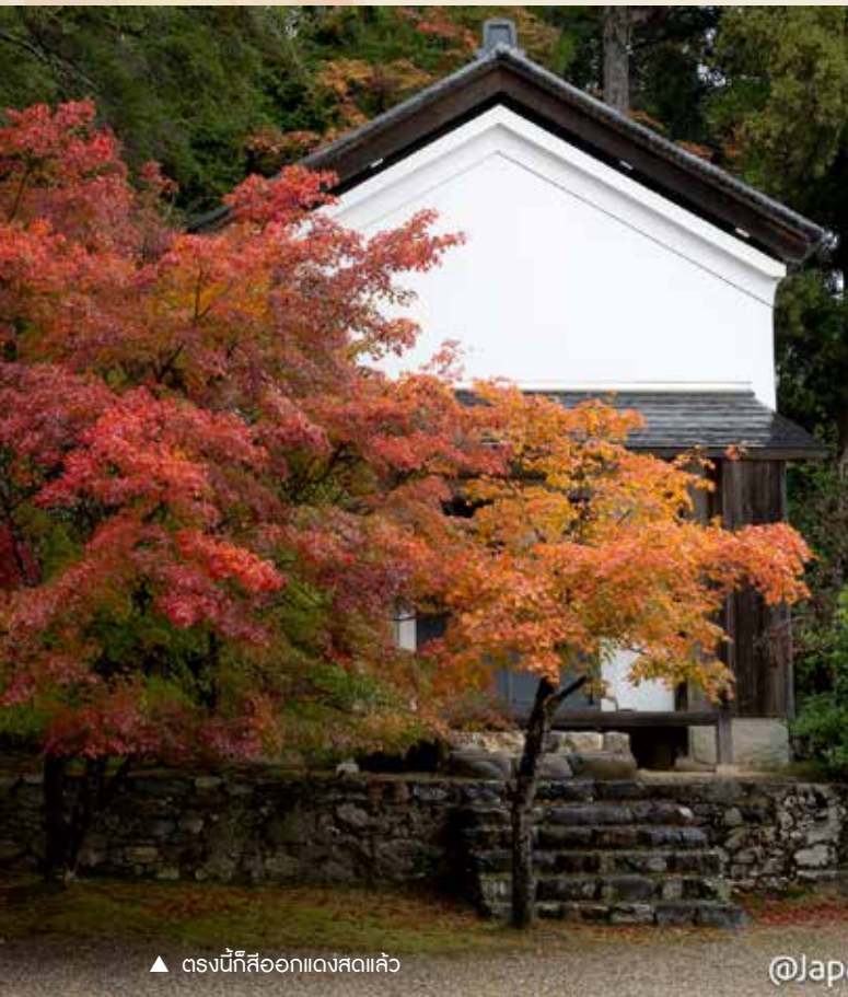
▲ ตรงนี้ก็สีออกแดงแล้ว