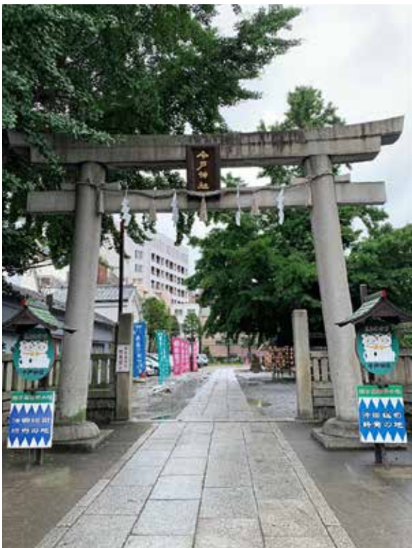
▲ รูปทิวของศาลเจ้าอิมาดะ