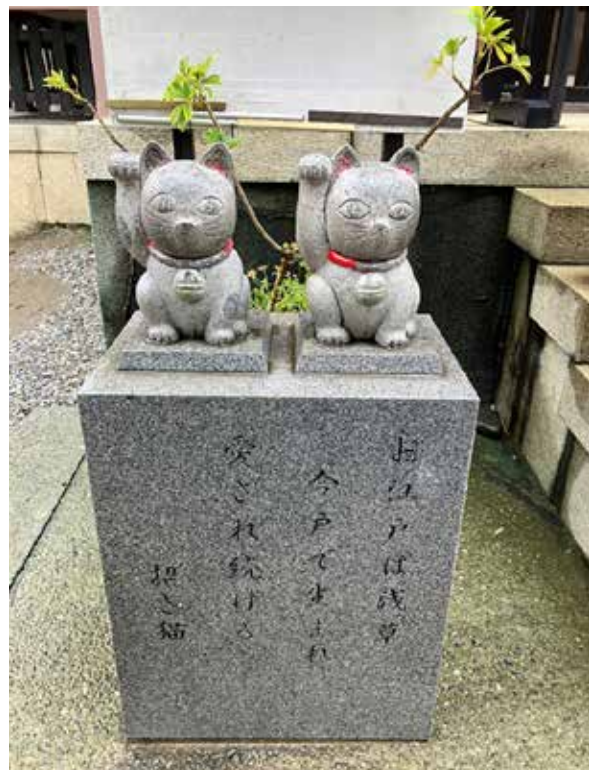
▲ รูปปั้นแมวกวักในศาลเจ้าอิมาดะ